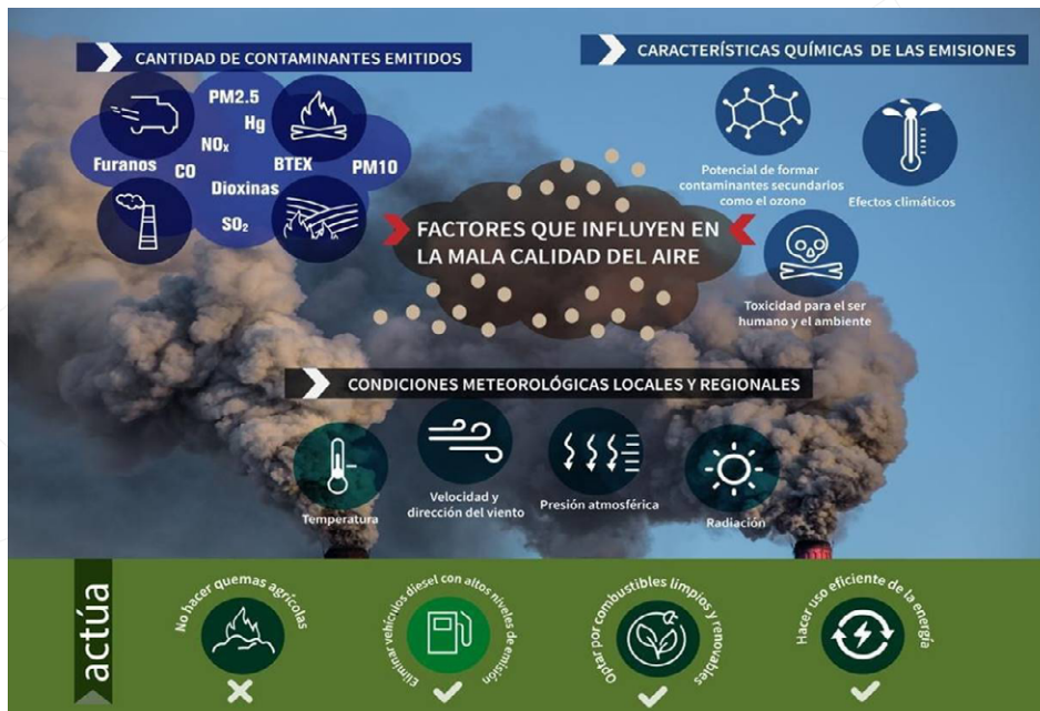
Figura 2. Factores que influyen en una mala calidad del aire.

Las redes de monitoreo atmosférico forman parte de un sistema de observación, monitoreo y evaluación de datos de la calidad del aire que permite establecer estándares y criterios técnicos para una adecuada gestión ambiental (García et al. , 2025). La información generada por estas redes no contribuye por sí sola a la mitigación y adaptación, pero constituye un insumo fundamental para diseñar, ajustar y evaluar las acciones de control de emi-